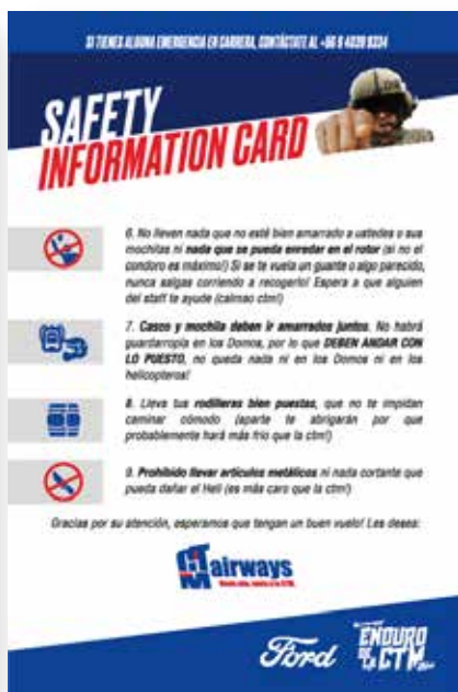
SAFETY INFORMATION CARD, DOCUMENTO DE LECTURA OBLIGATORIA!!