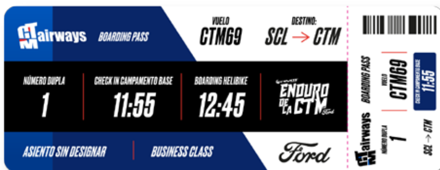
BOARDING PASS, CON HORARIOS DE CHECK IN EN CAMP / BOARDING HELIBIKE