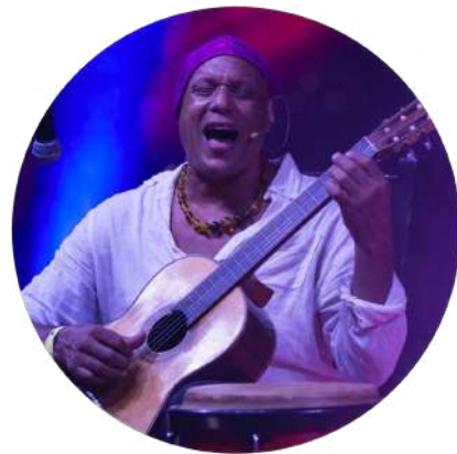
SADAHAKA HEALING SOUNDS