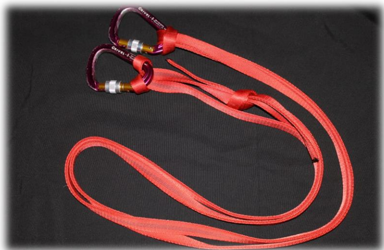
Anillas cocidas o cinta tubular con 2 mosquetones HMS

LA ORGANIZACIÓN NO PROVEE EL EQUIPO, CADA CORREDOR DEBE TRAER ESTOS ELEMENTOS PARA SU CORRECTA REVISIÓN Y CHEQUEO DE SEGURIDAD.